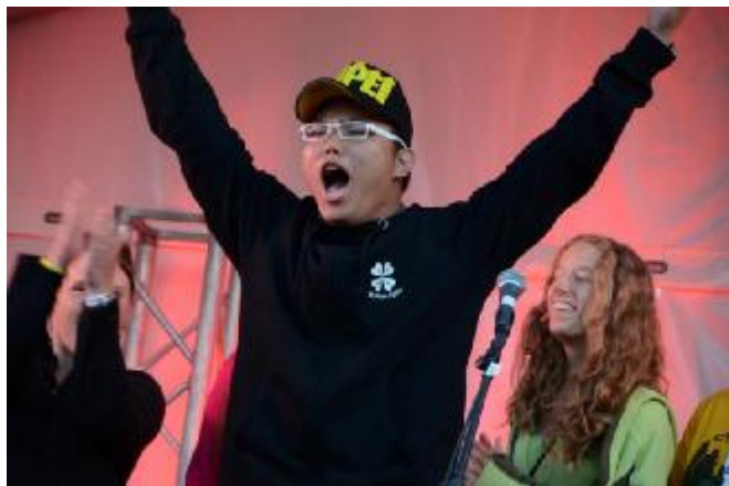
Allen på scena under presentasjonsrunden.

En av kveldene fikk vi også lov til å komme opp på scena for å